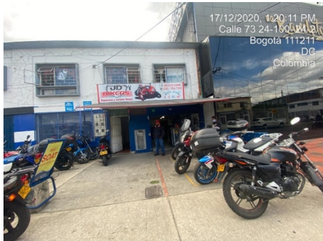
Fotografía panorámica del establecimiento.