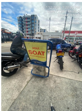
Fotografía aviso en espacio publico