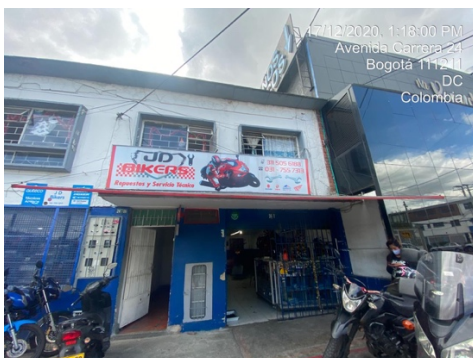
Fotografía aviso en fachada